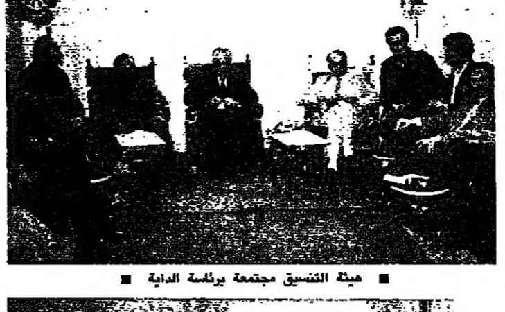
هيئة التنسيق مجتمعاً برئاسة الداية طرابلس - من كمال حيدر: استأنرت الاوضاع الامنية والاجتماعية طرابلس وتزايدت حوادث السلب المسلح والقتل واجراء القلق باهتمام مختلف القيادات السياسية والامينة والفعاليات المحلية التي كتبت اتصالاتها من لجهة درس ومناقشة المقترحات المكتوبة بتثبيت الوضع الامني في المدينة ووضع حد للقلق الذي يسيطر على بعض المواطنين والاحياء لا سيما احياء القبة وجوارها.

وشددت هذه القيادات على ضرورة تطبيق القرارات التي اتخذتها اللجنة الامنية والاطمئنان في اجتماعاتها الاخيرة والمتعلقة بمنع المظاهر المسلحة في جميع احياء طرابلس وتكثيف الحواجز والسيارات الامنية واعمالها الاضخاص المشتببه بهم واحتهم الى التحقيق. وكذلك تعزيز الدوريات خلال الليل في شوارع المدينة الرئيسية للمراقبة ووضع حد للسلب على السيارات والمنازل.